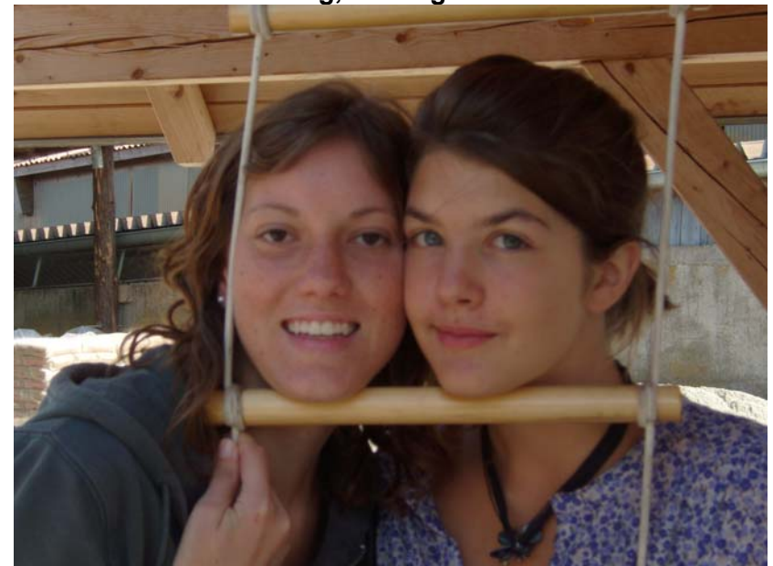
Unsere beiden FA`s immer gut drauf...