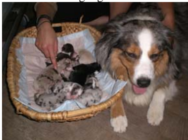
Sari beim „Bettenmachen“ bewacht ihre Kleinen währenddessen....

Wir rechnen in den nächsten Tagen mit Missys Welpen und freuen uns, wenn alles wieder gut geht und ihr auch alle schön Rücksicht nehmt und im Haus euch auch gerade nachts und am Morgen leise verhaltet – denkt daran, dass die Hunde zehnmal besser hören und für sie das Türenschielen und Kreiseln in den Zimmern schon zur Lärmbelästigung werden kann.