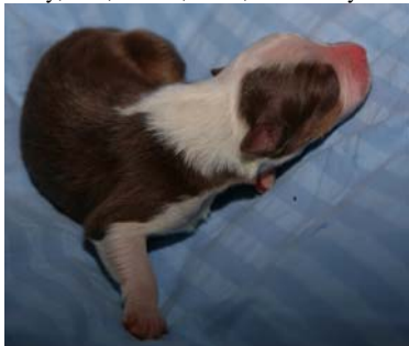
Hier "Bruce" in voller Größe....

Seit gestern Mittag haben auch die 7 Jungs und 4 Mädchen von Missy ihre Namen... Bruce, Jacko, Elvis, Amy, Milka, Nelly, Kelly, Ben, Milow, Nana, und Jimmy