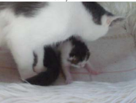
Keks bei den ersten Gehversuchen....