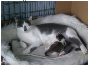
Öhrchen genießt ihr „kleines“ Baby immer ganz entspannt...