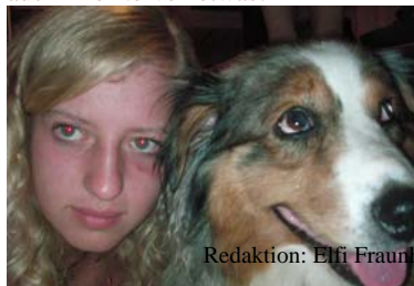
Redaktion: Elfi Fraunholz *** Layout: Elfi Fraunholz *** Fotos: Ferienkinder und Elfi Fraunholz

Sobald die Welpen da sind, werden wir euch natürlich genauestens informieren – bitte nehmt aber ganz arg Rücksicht auf die Hündinnen, sie brauchen in den ersten Tagen ganz viel Ruhe und müssen sich von der Geburt erholen und auf das Stillen ihrer kleinen Racker konzentrieren. Elfi wird auch wenig Schlaf abbekommen, da sie oft nachts noch nachsehen muss, ob auch die Kleinsten an die dicken Zitzen kommen und alles okay ist..., schont auch ihre Nerven etwas!