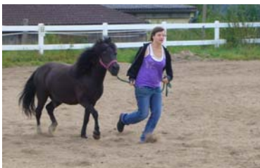
...bitte nicht rennen, sondern grasen lassen...in Zukunft ☺ ☺