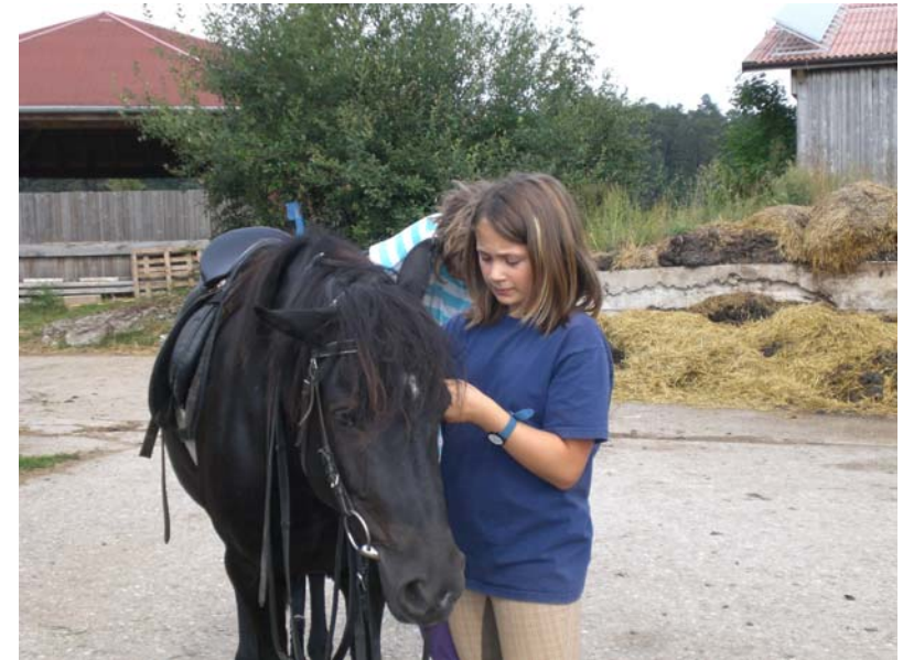
...mal sehen, ob es alles so richtig ist....