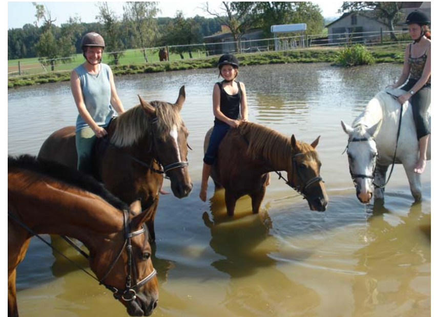
Meeting im Pferdeteich...