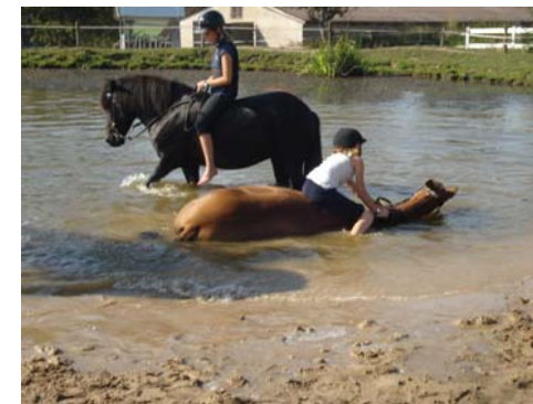
Schlammbad gefällig?? Mit oder ohne Reiter....???

Ich glaube ich werde Ihm eine Mütze schicken.