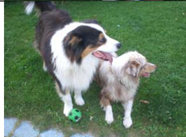
Hast du auch was gehört da drüben... sollen wir mal nachsehen....???

Redaktion: Elfi Fraunholz *** Layout: Elfi Fraunholz *** Fotos: Ferienkinder und Elfi Fraunholz