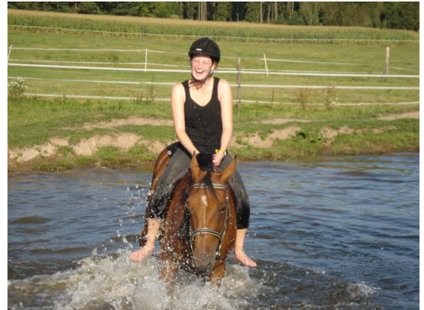
...nicht nur den Pferden macht das Baden Spaß....