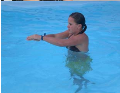
Schwimmunterricht in Lohe???