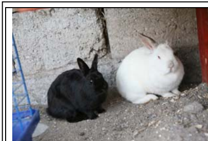
Unsere Häschen freuen sich immer über Besucht und Streicheleinheiten...