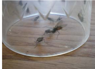
unsere neusten Fliegengefängnisse...