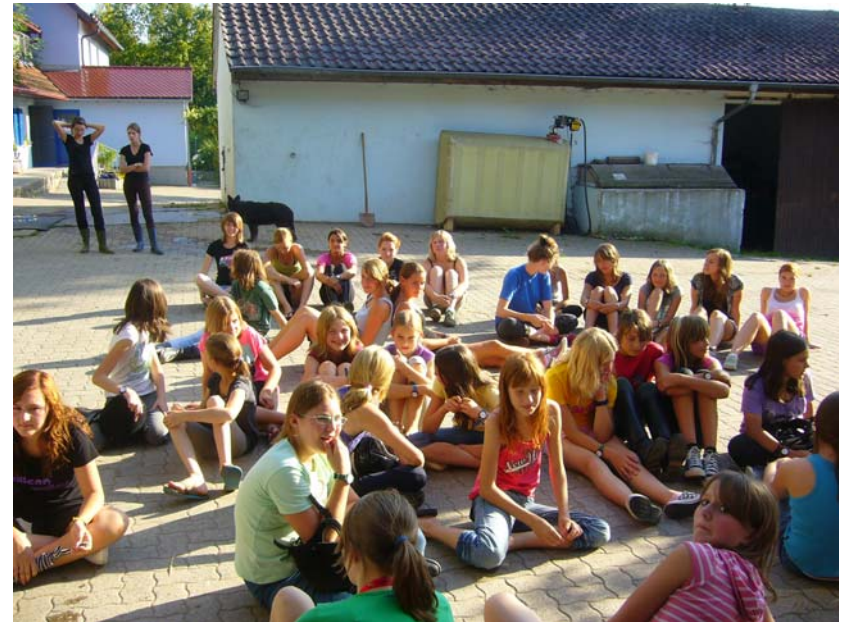
..aufmerksame Zuhörer beim Füttern erklären....