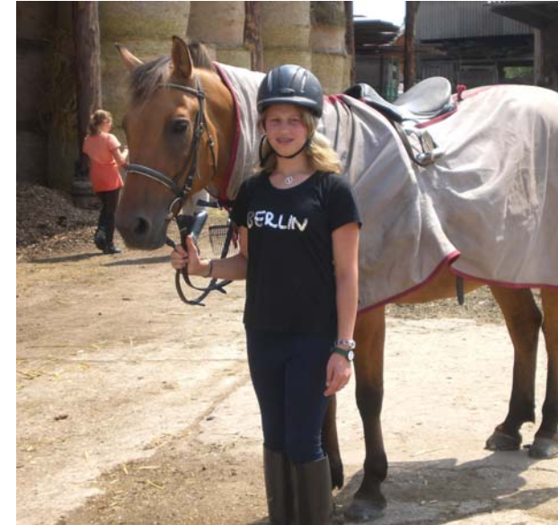
..wirklich von Berlin bis Lohe geritten? ☺