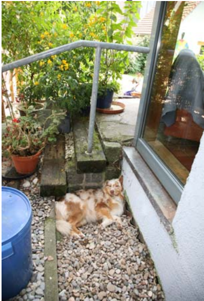
Winnie liebt es kühl, ruhig und steinig....