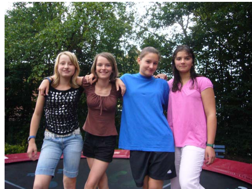
Lohes next „Topmodels“...