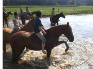
Das Pferdebad ist einfach schön für reiter und Pferd und macht immer wieder Spaß und sorgt für abgekühlte Pferdebeine...