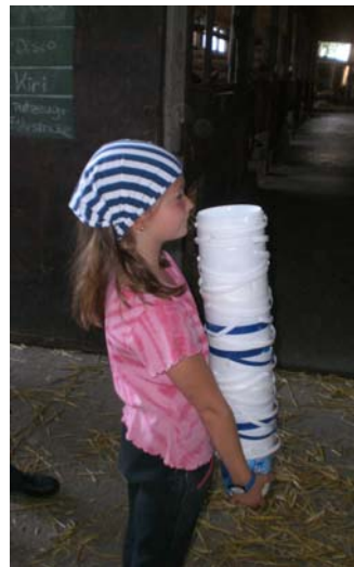
..so denken wir, sehen „Hochstapler“ aus...

...wenn ihr euch im Brötchenkorb immer einfach was von einer Semmel abbreht und den Rest wieder rein werft... entweder ihr sucht euch jemand, der mit euch eine Semmel teilt oder ihr wartet bis ihr hungrig genug für eine ganze Semmel seid... ☺