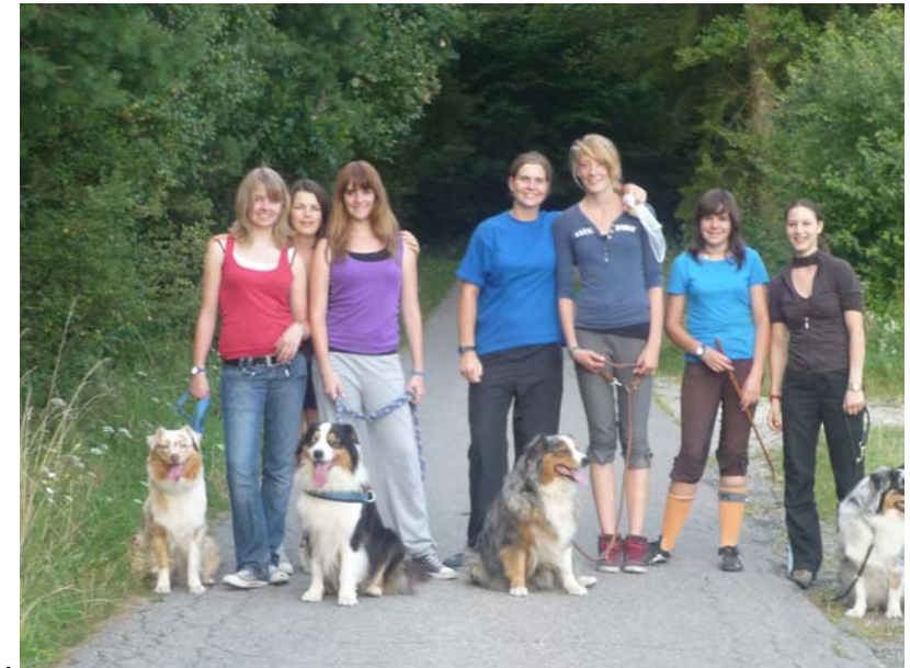
..unsere Hundeausführtruppe in Aktion....