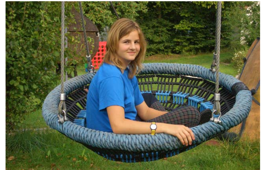
...so sehen „Nesthäkchen“ in Lohe aus?!?