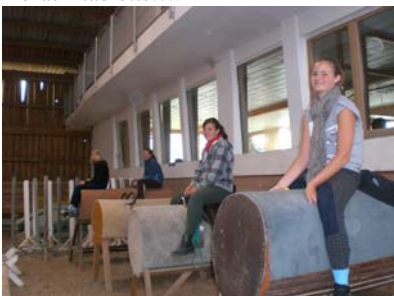
Mädels bei den „Trockenübungen“....