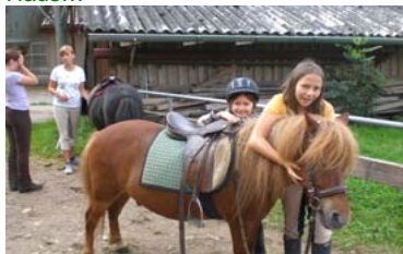
unholz *** Layout: Elfi Fraunholz

Hebamme zur Gebärenden: Möchten Sie den Vater des Kindes bei der Geburt dabei haben?