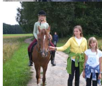
alle haben mal angefangen zu Reiten.... auch ein Führsritt kann lustig sein, wenn man nette Führer hat....