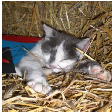
Öhrchen schläft gerne im Stroh und geht nur noch selten ins Haus...