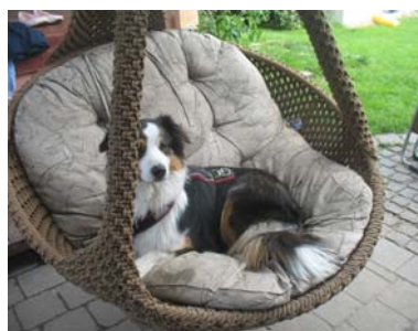
Kira hat inzwischen die Gemütlichkeit des Hängesofas im Garten entdeckt...