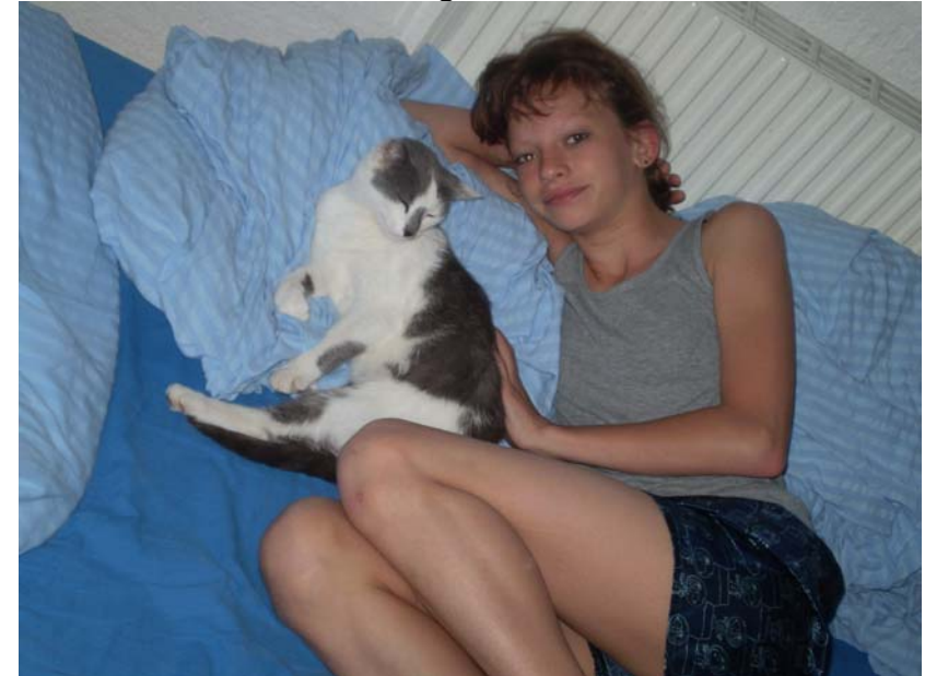
Öhrchen versucht sich die gleiche elegante Fußstellung abzuschauen... obs wohl gelingt????