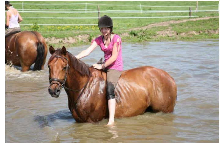
...das Baden mit den Pferden im „Pferdepool“ macht allen Spaß...