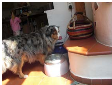
Sari bei der ständigen Suche nach vollen Futtertrögen... - vergisst nicht Ohrchen immer aus dem Zimmer zu lassen, wenn ihr geht, da es sonst zu Bescherungen kommen kann