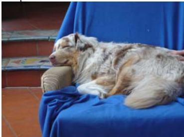
...meist liegt sie auf ihrem Lieblingsplatz und wartet auf Krauleinheiten...