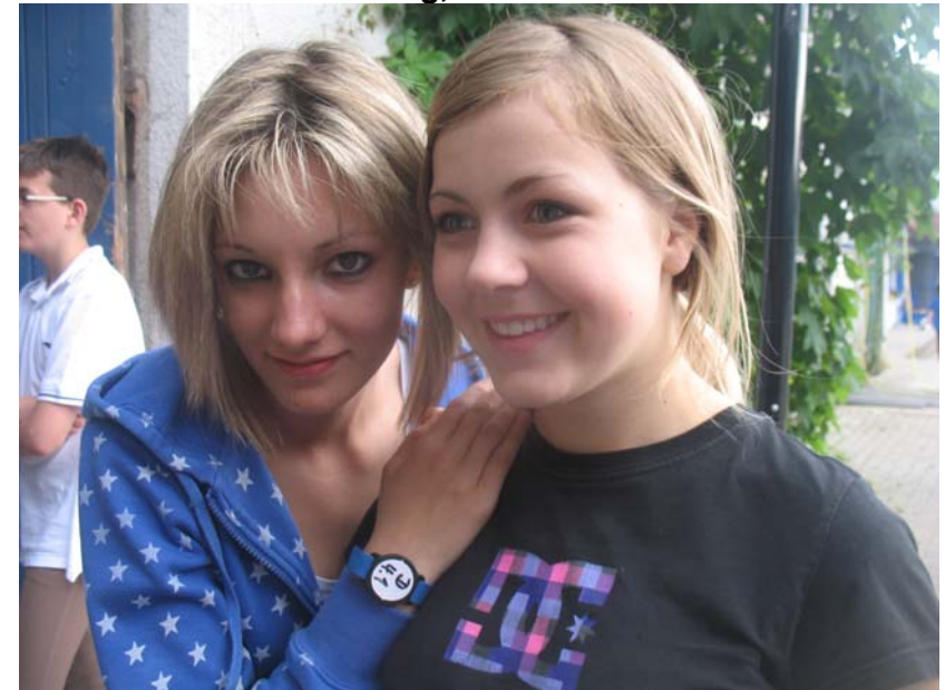
...ganz gespannt wird auf das Pferdefüttern gewartet...