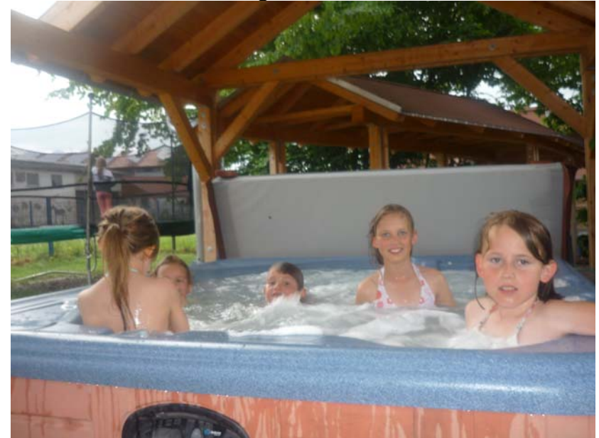
...im 42 Grad warmen Whirlpool kann man seine verspannten Muskeln lockern....