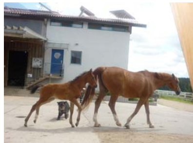
Fenja ist super fit und freut sich immer mit Mama auf die Koppel zu dürfen...