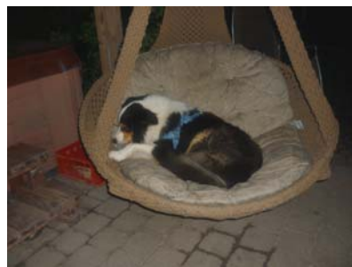
Balus Schlafplatz in der Nacht... hier kann er richtig relaxen....