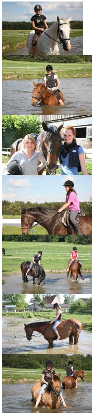
Bitte lasst eure Schlüsselbändchen immer dran, sie sind absolut wasserfest!!