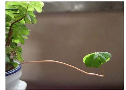
Abstand: - Wegwollen oder Himmöchten?