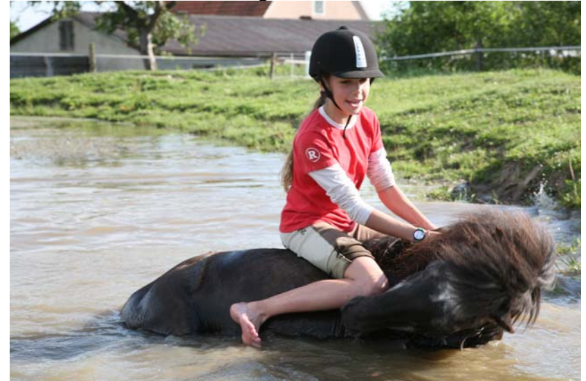
...los nimm die Beine hoch, jetzt gehen wir ne Runde schwimmen...