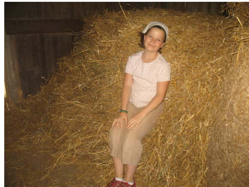
.... "Stuhlsitz" im Stroh.....