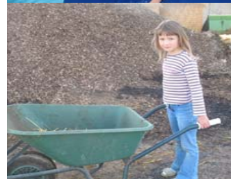
..früh übt sich....