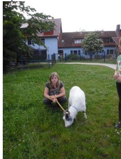
..viel Geduld braucht man bei den Ziegen....