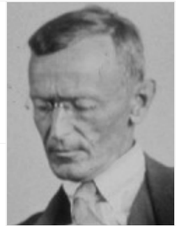
Hermann Hesse, 02.07.1877 - 09.08.1962

Man muss das Unmögliche Versuchen, um das Mögliche zu erreichen.