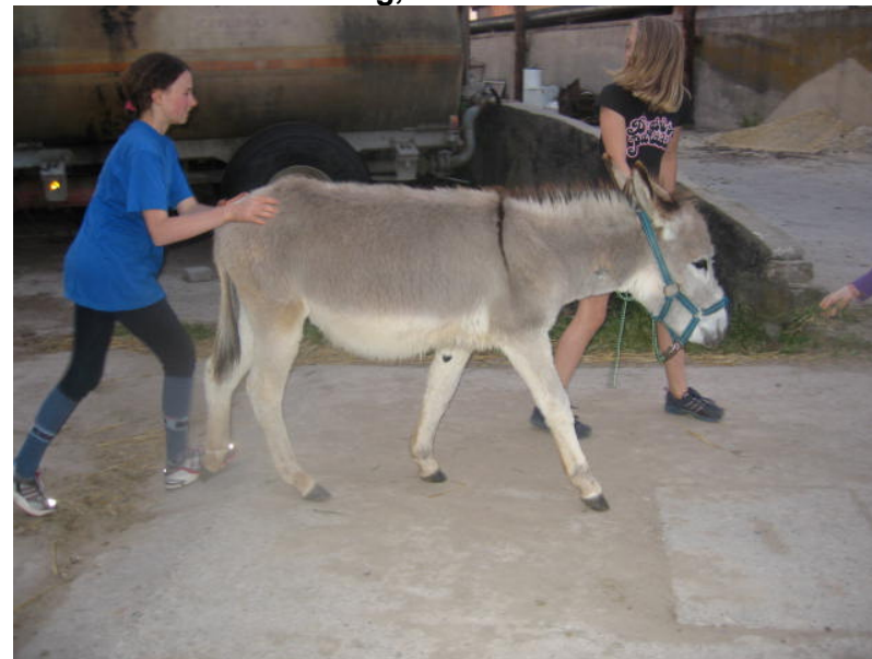
...wer sein Esel liebt.... Der schieb.....