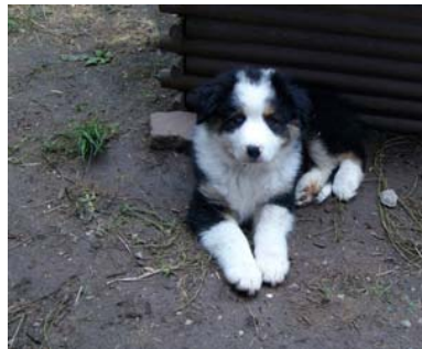
Elektra unsere Prinzessin....