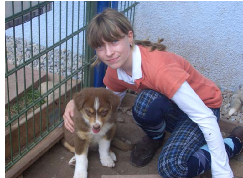
...die Welpen sind der „Hit“ ... und zum knuddeln lieb...