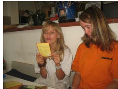
eines der wenigen verwertbaren Bilder.

Die heutige Zeitung wird erst mal hauptsächlich in schwarz/weiß sein, damit ich mir wenigstens die Farbe spare.