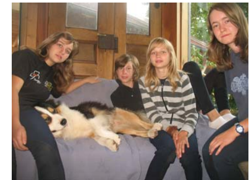
Balu macht sich ganz schön breit auf dem Sofa....

"Lass ihn nur drin, du scheint's zu wissen."