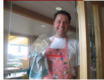
der einzige Mann grad auf dem Hof – und so emanzipiert!!!