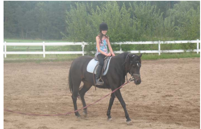
...juhuuuuuu, das 1. und Einzige Bild bisher eines reitenden Kindes – es gibt sie doch in Lohe, die „Reiterkinder“... ☺