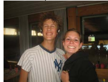
...um die Wette lächeln....