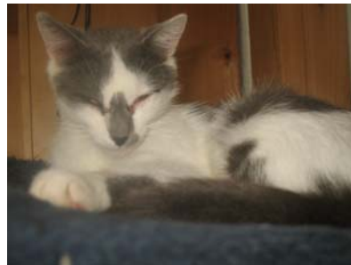
Öhrchen ist nach dem Stillen ihrer Babys noch immer recht dünn, obwohl sie soviel zu fressen bekommt, wie sie möchte....

Die Kleinen haben gerade noch so Platz im Hundestrandkorb... →