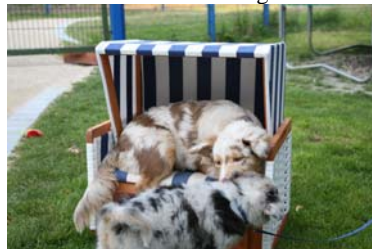
Winnie verteidigt ihren Strandkorb...

Beim abendlich Gassigehen mit den Hunden, achtet auch bitte darauf, dass die Hunde richtig angeleint sind, wenn sie an der Stelle gerade ein doppeltes Halsband haben, dann macht den Karabiner bitte um alle beiden Bänder an dieser Stelle, manche haben auch einen Ring am Halsband (die bunten Halsbänder!). Lasst sie ruhig mit Winnie toben, sie können sich inzwischen gut wehren und müssen dies auch lernen, ebenso natürlich die Unterordnung.