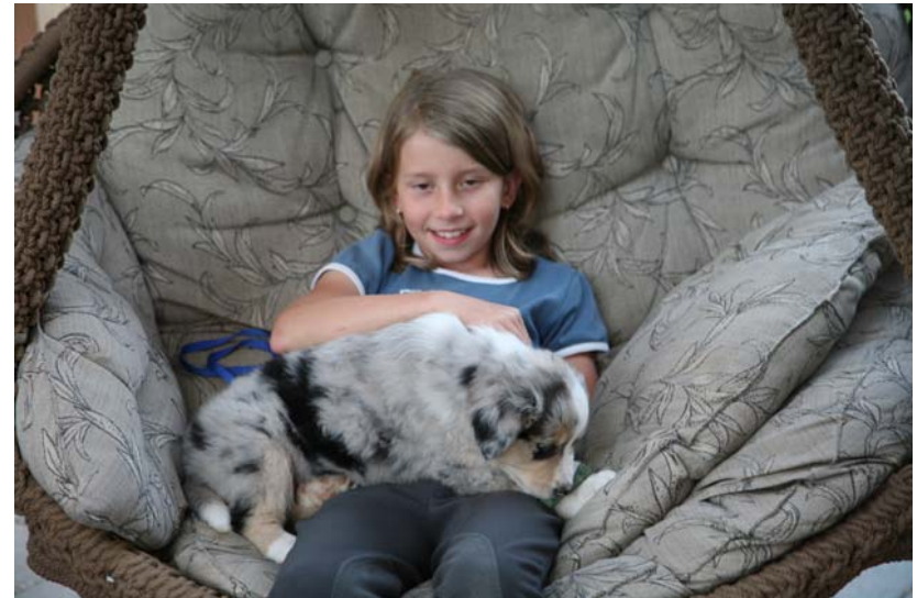
.... Die Hunde sind einfach im Moment neben den Pferden einfach der „Hit“...