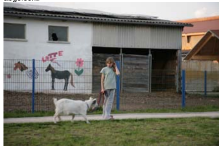
Gassigehen mit den Ziegen funktioniert ganz gut....

Erste Vorlesung der Medizinstudenten im ersten Semester: Prof: "Meine Damen und Herren, zwei Dinge zeichnen einen guten Arzt aus. Erstens: die Fähigkeit Ekel zu überwinden, zweitens: messerscharfe Beobachtungsgabe. Wir fangen heute mit der Ekelüberwindung an." Sprachs und tauchte seinen Finger in ein Glas mit ekeliger, stinkender, grün-gelber Flüssigkeit. Er zieht den Finger wieder raus und leckt ihn zum Entsetzen der Studenten ab. Er nimmt das Glas, geht zur ersten Sitzreihe und stellt es vor einem Studenten auf den Tisch... Der ziert sich eine Weile, taucht aber dann doch schliesslich seinen Finger in das Glas und leckt ihn ab. Meint der Prof: "Ihren Ekel haben sie zwar überwunden, aber Ihre Beobachtungsgabe lässt doch sehr zu wünschen übrig. Denn ich habe den Zeigefinger eingetaucht und den Mittelfinger abgeleckt."