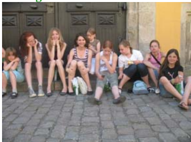
Stadtkinder beim Warten auf den Bus....

Vergesst nicht, dass ihr eure Pflegepferde immer bis 12:00 Uhr versorgt.....!!!