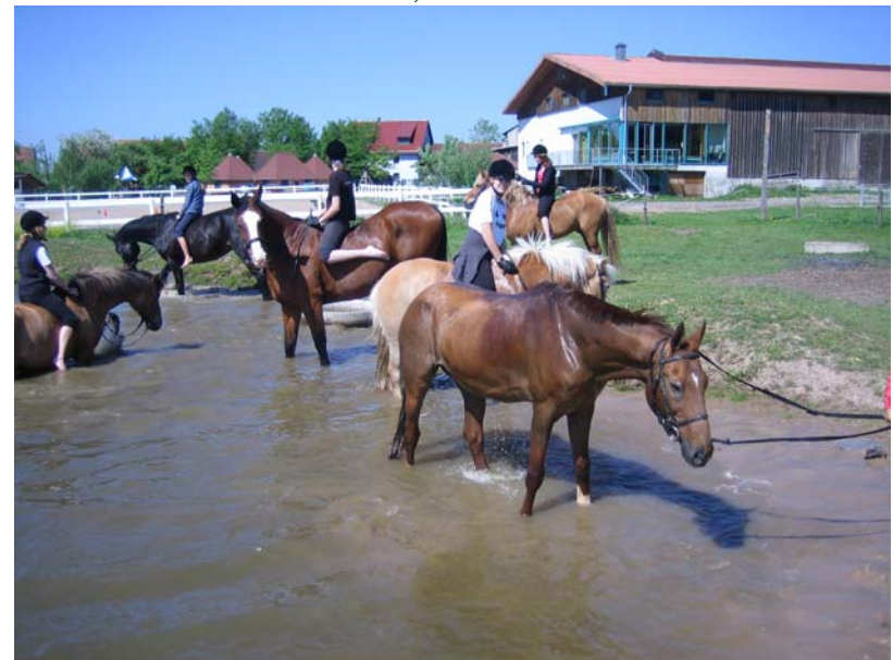
mit den Pferden baden gehen – das Highlight....