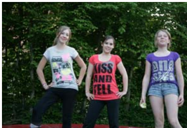
Erwischt!!!! – zu dritt!!!!