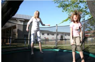
Beim Trampolin hüpfen seid ihr immer nur zu zweit , bitte auch nicht auf den Rand setzen, da sonst die Federn den Bezug von unten ständig einzwicken und somit kaputt machen! Wenn jemand ansteht, wird nach 5 min. gewechselt!!!

Heute Abend ab 19:00 Uhr wird das Dampfbad warm sein, bitte achtet darauf, dass ihr die Türe immer hinter euch schließt und keine zu große „Sauererei“ im Badhaus entsteht..... – wir putzen dort täglich, allerdings ist es nicht für Stallschube gedacht!!!