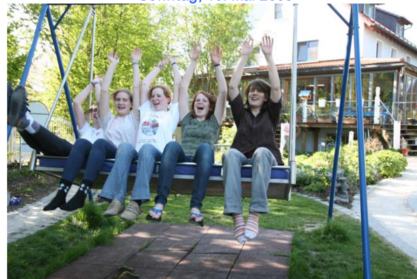
... Juhuuu – endlich auf dem Reiterhof....