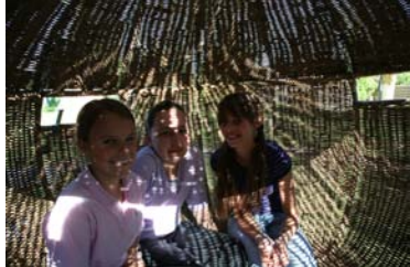
...ein lauschiges, schattiges Plätzchen, das sich auch noch bewegt... unsere Weltenschaukel..