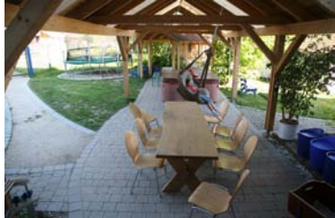
bei wunderschönem Wetter und auch ganz sicher bei Regen, könnt ihr jetzt immer auch geschützt draußen essen, bitte vergesst aber nicht, trotzdem eure Teller und Gläser auf zu räumen!