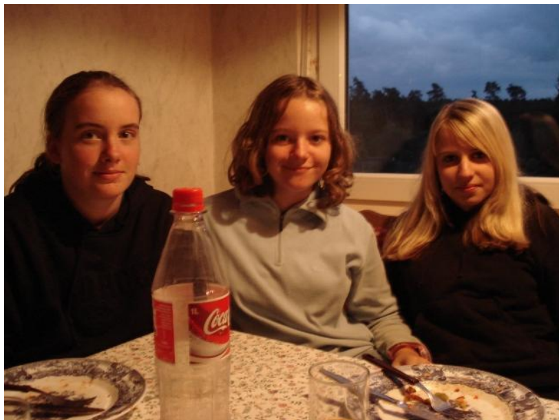
genau so sehen drei satte zufriedene Reiterinnen aus ☺

und auch wir fanden wieder vorzügliche Zimmer vor. Noch schnell geduscht und frisch gemacht, da rief uns schon der köstliche Duft nach selbstgebackener Pizza an die Tische. In scheinbar unendlichen Mengen bekamen wir das leckere Gericht vorgesetzt und wirklich jeder wurde satt!