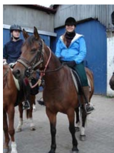
Franzi und Pumuckl